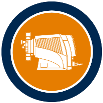
Sistemas de dosificación