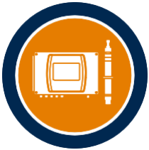
Sistemas de medición, regulación y sensores