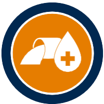
Tratamiento y desinfección de aguas

Encontrará los distintos catálogos para descarga o para consulta en línea en: