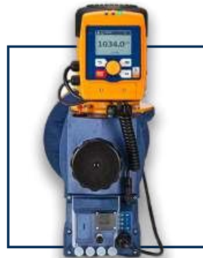
SIGMA CON CONTROL

CAUDAL [l/h]PRESIÓN [bar] 42 - 100010 - 4