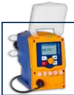
DULCOflex CONTROL DFXα

En las bombas peristálticas el proceso de bombeo se activa a través de una manguera a la que dos rodillos giratorios presionan contra la carcasa de la bomba. Las mangueras de alto rendimiento utilizadas por ProMinent convencen especialmente por su excepcional durabilidad y su amplia compatibilidad química.