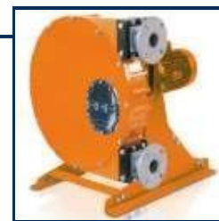
DULCOflex CONTROL DFDα