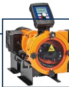
DULCOflex CONTROL DFYα

CAUDAL [l/h] PRESIÓN [bar] 30 – 65 7 – 5